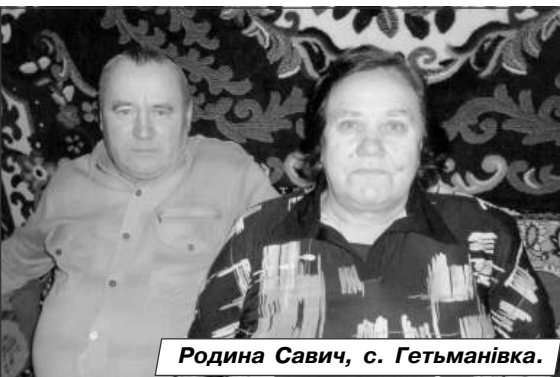
Родина Савич, с. Гетьманівка.