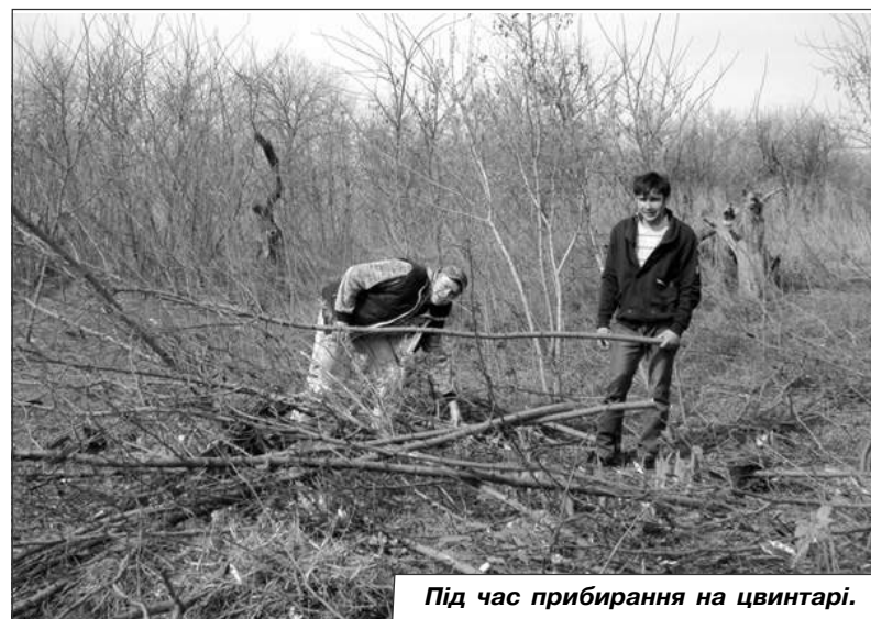
Під час прибирання на цвинтарі.